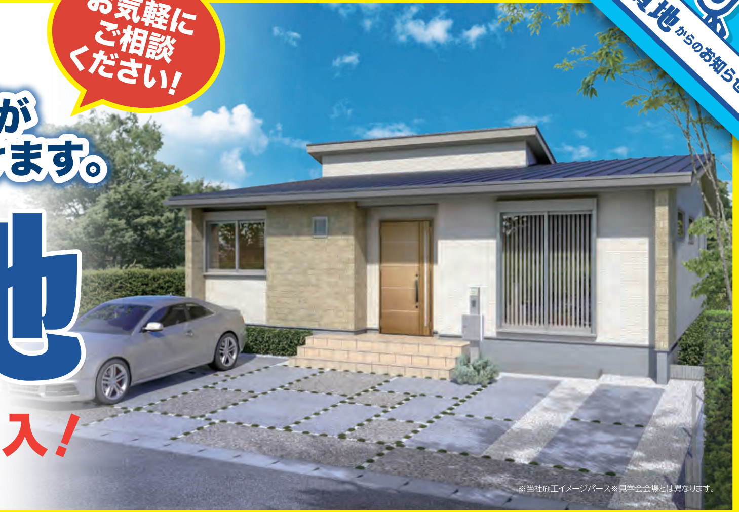
※当社施工イメージパース※見学会会場とは異なります。